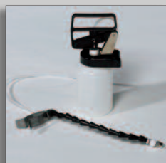
Serbatoio spray clean