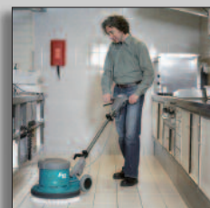
Macchina in azione