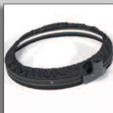
Anello di aspirazione