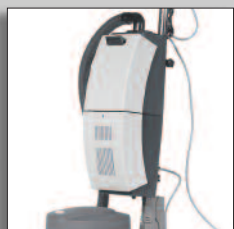
Unità di aspirazione