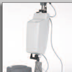
Réservoir de solution (14 L)