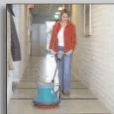
Máquina en acción