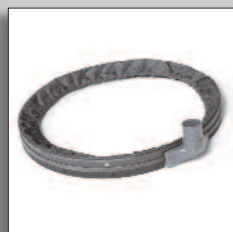
Timbre de succión