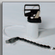
Serbatoio spray cleaning