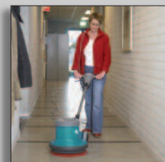
Macchina in azione