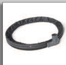
Anello di aspirazione