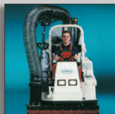
Zuigmond over totaal breedte machine