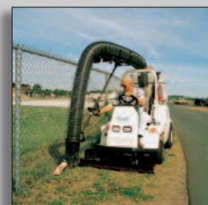
Machine in actie