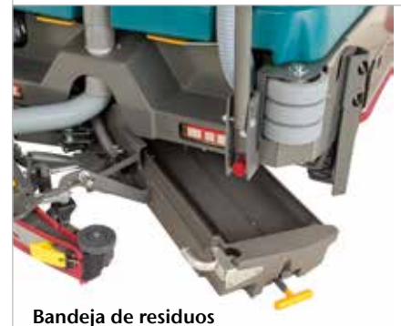
Bandeja de residuos