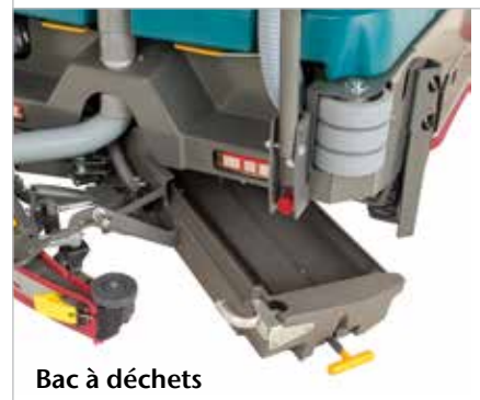
Bac à déchets