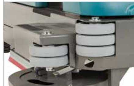
Châssis robuste et roulettes de coin amorties

Le toit de protection protège l'opérateur contre la chute d'objets.