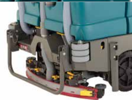
Raclette parabolique Dura-Track™