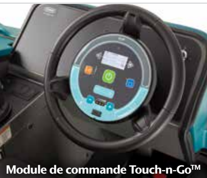
Module de commande Touch-n-Go™