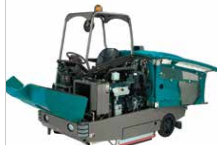
Conception facile d'accès