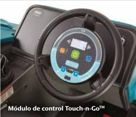
Módulo de control Touch-n-Go™