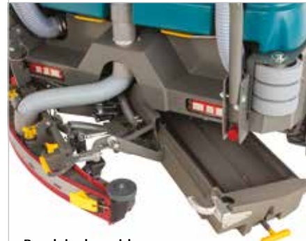
Bandeja de residuos