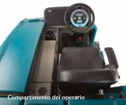
Compartimento del operario