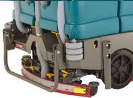
Bayeta parabólica Dura-Track™