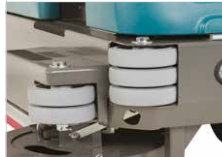
Chasis para tareas pesadas y rodillos de esquina acolchados

Tejadillo de protección que previene que el operario sea golpeado por objetos que salgan despedidos.