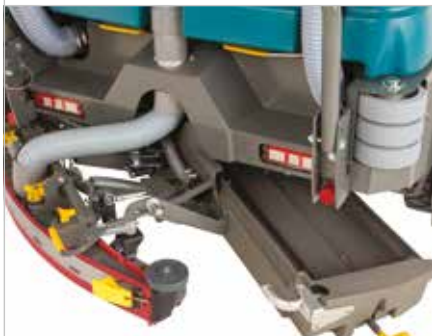
Recipiente do lixo