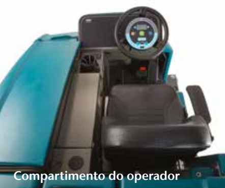
Compartimento do operador