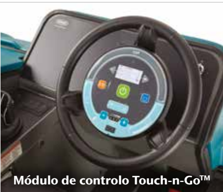
Módulo de controlo Touch-n-Go™