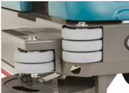
Estrutura resistente e rolos de canto almofadados

A proteção superior protege os operadores contra a queda de objetos.