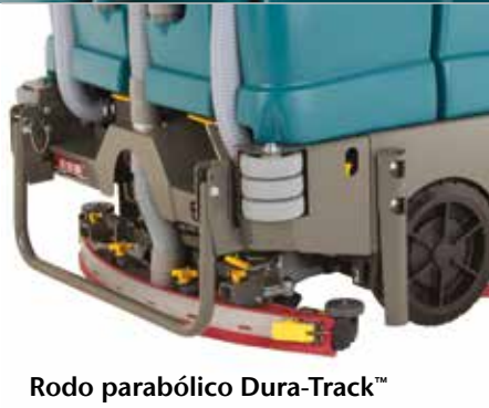
Rodo parabólico Dura-Track™