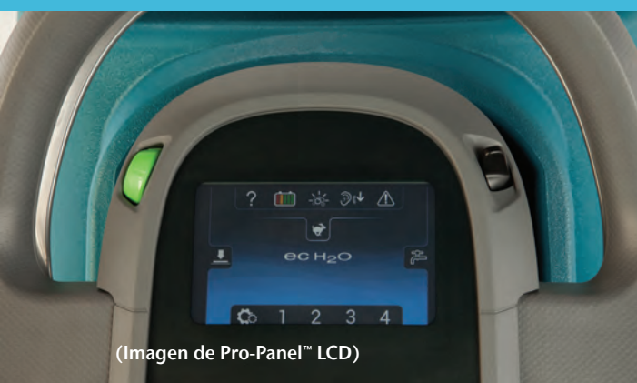
(Imagen de Pro-Panel™ LCD)

La restregadora T300 junto con el sistema de protección para pisos duros 3M™ ofrecen un proceso completo para el cuidado de los pisos que les devuelve la belleza natural a sus pisos de piedra porosos y les brinda un brillo asombroso y duradero.