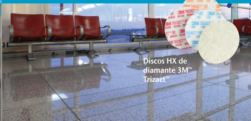
Discos HX de diamante 3M™ Trizact™