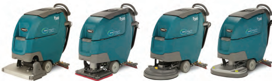
Doble cilíndrico: 20 pulg./500 mm

Las restregadoras T300 cuentan con varios tipos de cabezales para la máquina que se adaptan a sus aplicaciones de limpieza y optimizan el rendimiento de limpieza para áreas específicas.