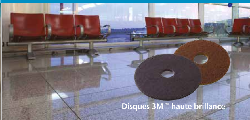
Disques 3M™ haute brillance