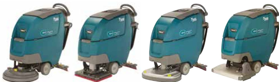
Disque simple : 430 mm et 500 mm

Les autolaveuses T300 sont équipées de multiples types de tête afin de s'adapter à vos besoins de nettoyage et d'optimiser les performances de nettoyage.