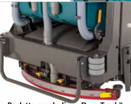
Raclette parabolique Dura-Track™