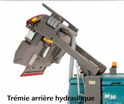
Trémie arrière hydraulique