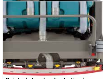
Points de touche d'entretien jaunes

Le toit de protection protège l'opérateur contre la chute d'objets.