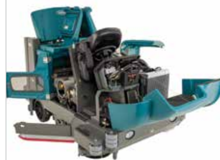
Conception facile d'accès