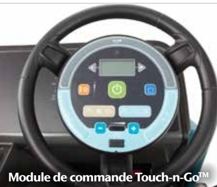
Module de commande Touch-n-Go™