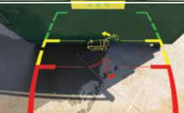
Caméra de marche arrière