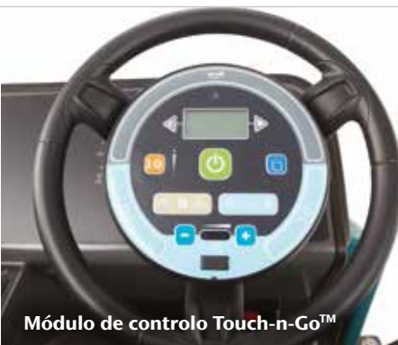
Módulo de controlo Touch-n-Go™