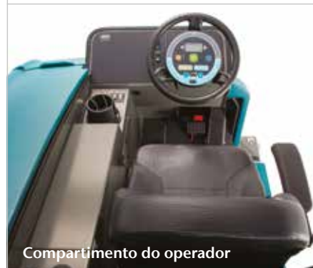
Compartimento do operador