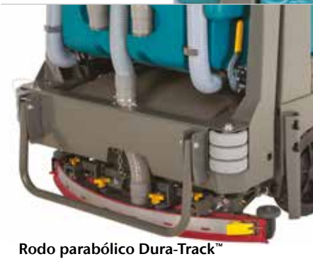
Rodo parabólico Dura-Track™