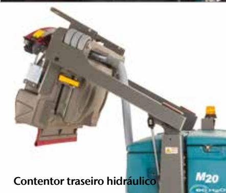
Contentor traseiro hidráulico