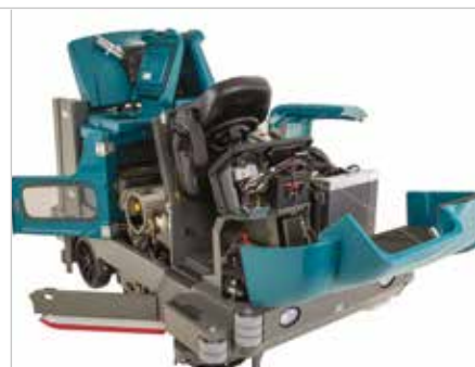
Design de fácil acesso