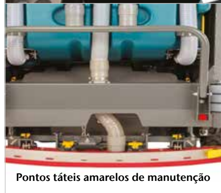
Pontos táteis amarelos de manutenção

A proteção superior protege os operadores contra a queda de objetos.