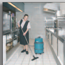
Máquina en acción