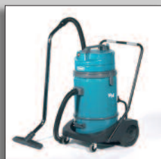
V14 gran capacidad con trolley