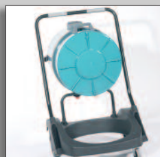
Trolley con inclinación