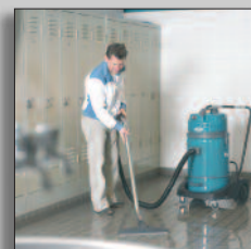
Máquina en acción