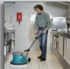
Máquina en acción