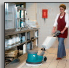
Maschine im Einsatz