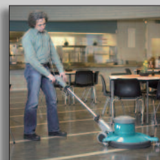
Maskinen i drift