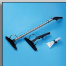
Herramientas de pared y tapicería