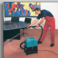
Maquina en acción