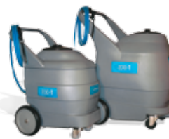
87L Y 174 L DE SOLUCIÓN CARROS DE TRANSPORTE

Tennant España • C/ Aragoneses 11, posterior • 28108 Alcobendas, Madrid • España • 900 900 150 • orbio.com