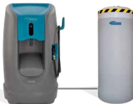
DEPÓSITO AUXILIAR 500 L

Personalice el sistema Orbio® 5000-Sc para su instalación y procesos de limpieza. Los depósitos auxiliares amplían el volumen de solución que puede almacenar. Los carros de transporte de solución transportan un gran volumen de MultiSurface Cleaner a estaciones de trabajo remotas.