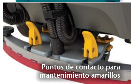
Puntos de contacto para mantenimiento amarillos