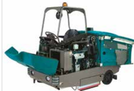
Das Design für einen einfachen Zugriff