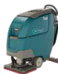
Versione orbitale: 500 mm