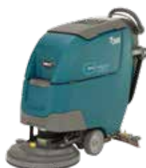
Disco: 430 mm e 500 mm

Sono diverse le tipologie di testata di cui la T300 è dotata. Tutte queste le consentono di adattarsi ad ogni esigenza di pulizia e applicazione, ottimizzando le prestazioni soprattutto in aree specifiche.