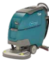
Doppia spazzola: 600 mm