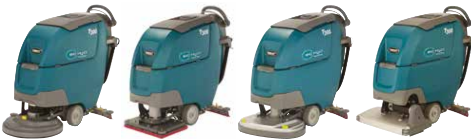
Monoteller: 430 mm & 500 mm

Die T300 Scheuersaugmaschine gibt es mit unterschiedlichen Typen von Schrubbköpfen, die auf Ihre Reinigungsanforderungen zugeschnitten sind und die Reinigungsleistung optimieren.