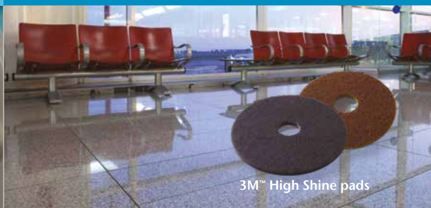
3M™ High Shine pads