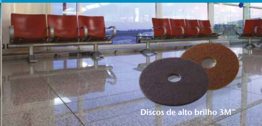
Discos de alto brilho 3M™