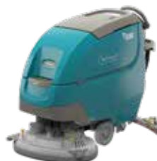
Doppio Disco: 650 mm e 700 mm e 800 mm