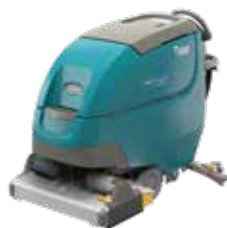
Cilindrica: 700 mm

Le varie testate della lavasciuga uomo a terra T500 permettono di pulire facilmente qualsiasi tipo di superficie dura e di massimizzare il tuo investimento.