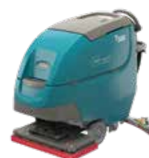
Orbitale: 700 mm