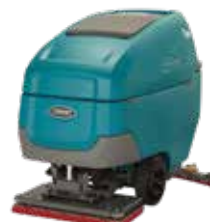
Orbital: 28 in / 700 mm