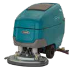
Disco doble: 28 in / 700 mm y 32 in / 800 mm y 36 in / 900 mm