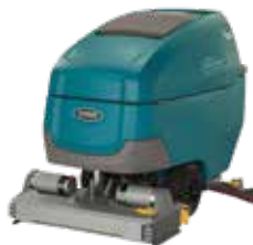
Cilíndrico: 28 in / 700 mm y 32 in / 800 mm

Las restregadoras T600 cuentan con varios tipos de cabezales para la máquina que se adaptan a sus aplicaciones de limpieza y optimizan el rendimiento de limpieza para áreas específicas.