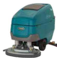
Doppio Disco: 700 mm, 800 mm e 900 mm