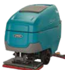
Orbitale: 700 mm