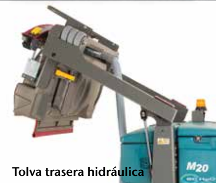
Tolva trasera hidráulica