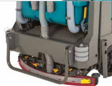
Escurreidor parabólico Dura-Track™