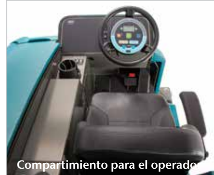
Compartimiento para el operador