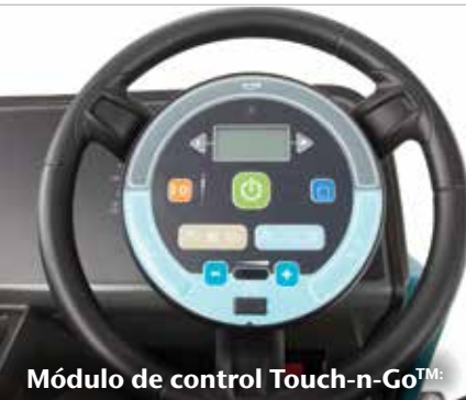
Módulo de control Touch-n-Go™: