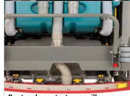
Puntos de contacto amarillos para mantenimiento

La guarda protectora superior protege a los operadores de la caída de objetos.