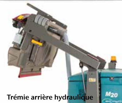
Trémie arrière hydraulique