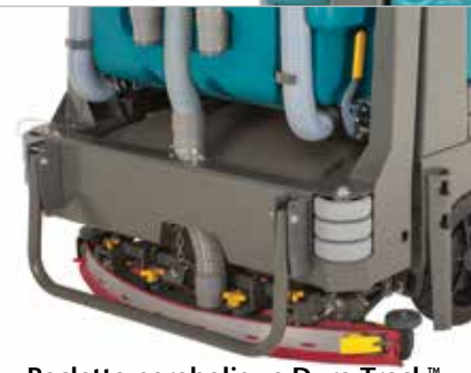
Raclette parabolique Dura-Track™