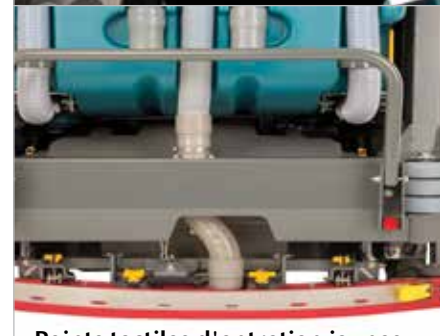
Points tactiles d'entretien jaunes

Le toit de protection protège l'opérateur contre la chute d'objets.