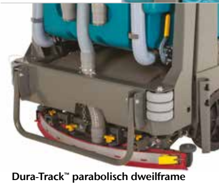
Dura-Track™ parabolisch dweilframe

Beschermkap beschermt gebruikers tegen vallende voorwerpen.