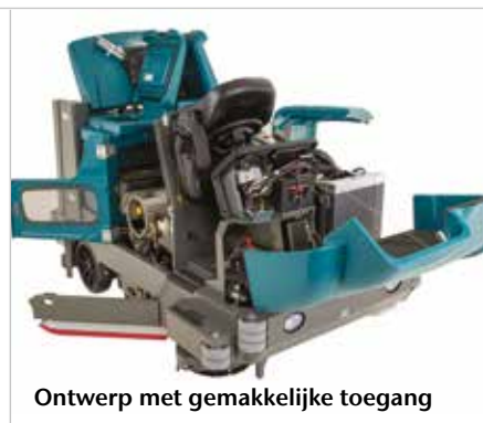
Ontwerp met gemakkelijke toegang

▶ Grote hydraulische vuilvergaarbak aan achterzijde met verschillende niveaus (110 L | 177 kg) verhoogt de reinigingsproductiviteit door het elimineren van de noodzaak om vuil handmatig te verwerken.