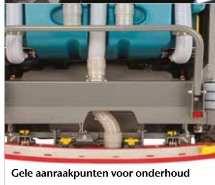
Gele aanraakpunten voor onderhoud

▶ Gele, gemakkelijk te herkennen aanraakpunten voor onderhoud besparen tijd en geld op routineonderhoud.