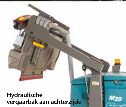
Hydraulische vergaarbak aan achterzijde

▶ Dura-Track™ parabolisch dweilframe met SmartRelease™ levert uitzonderlijke wateropname en vermindert onderhoud en vervanging van onderdelen wegens schade aan de dweilframe.