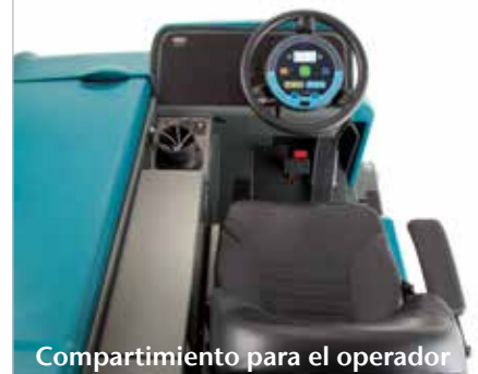
Compartimiento para el operador