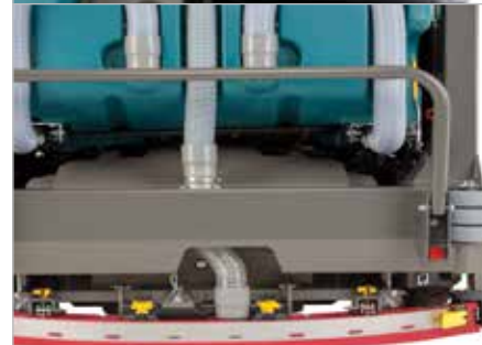
Puntos de contacto amarillos para mantenimiento

La guarda protectora superior protege a los operadores de la caída de objetos.