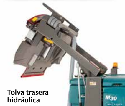
Tolva trasera hidráulica