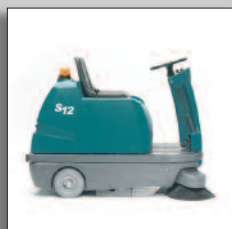
Cepillo lateral estándar