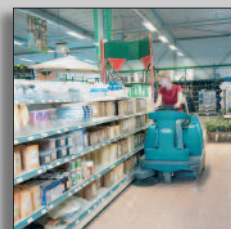
Macchina in azione