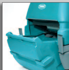
Contenitore polvere estraibile