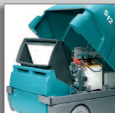
Sostituzione agevole del filtro