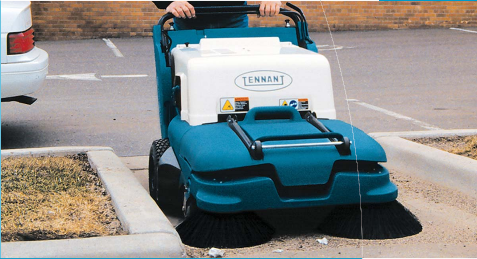
両サイドブラシ、ワイドタイヤキット装着車