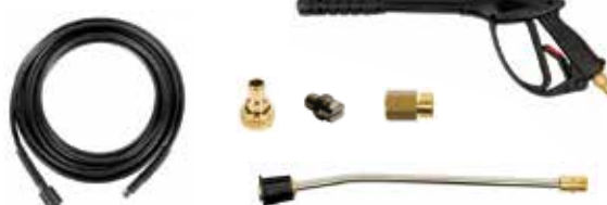
8m trama de aço