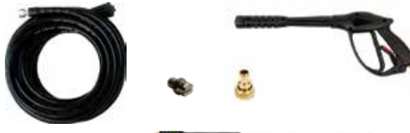
10m trama de aço