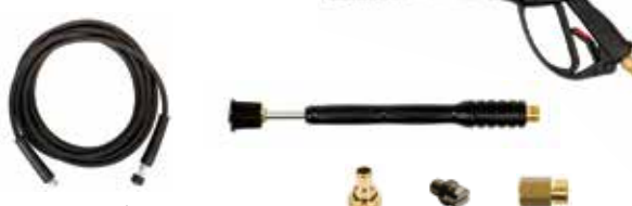
10m trama de aço